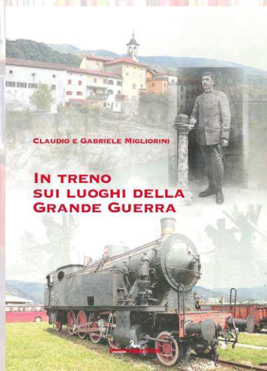
In treno sui luoghi della Grande Guerra. Pagine 72. Euro 14,00 da scontare.