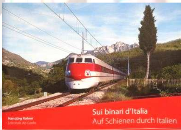
Sui binari d'Italia. Pagine 400. Euro 85,00 da scontare.