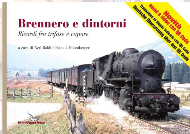
Brennero e dintorni. Pagine 112. Euro 23,00 da scontare.