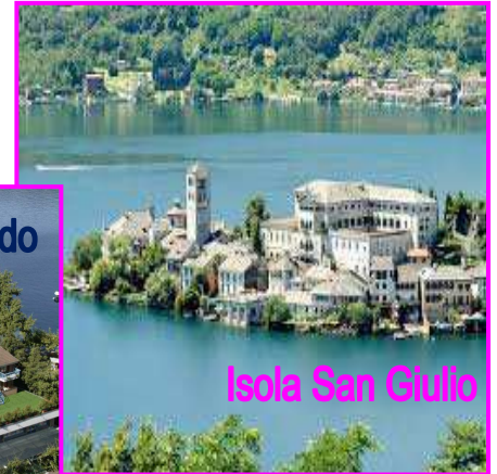
Isola San Giulio