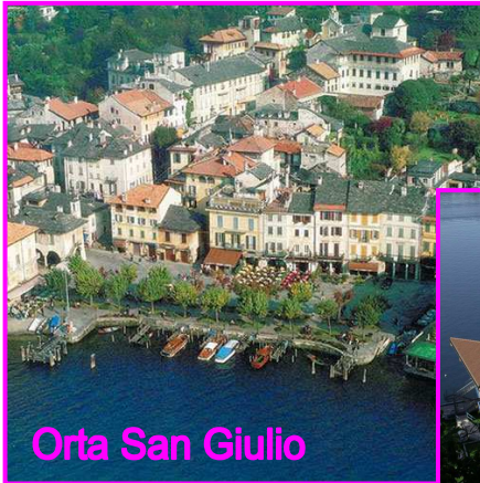
Orta San Giulio